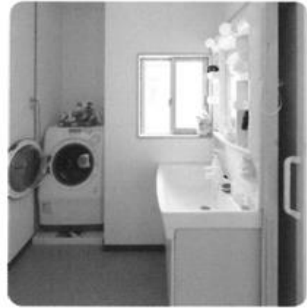
壁を半間移動し洗面脱衣室を拡大