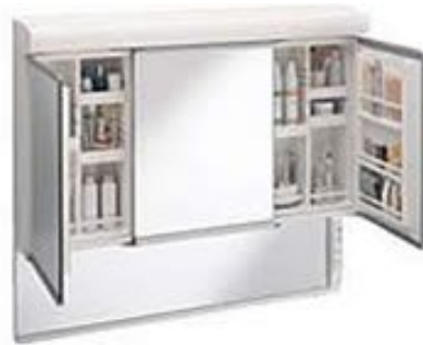
外側に開くとポケット収納付で小物 収納にも便利