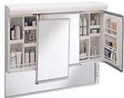
手元まで出てくるお手元で無理 なく身づくろいができます。