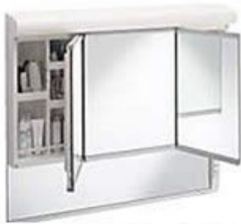
内側に開いて合わせ鏡

左右両開きの鏡扉（鏡裏ポケット収納）で便利さ倍増。 シンプルで見やすい、スウィング三面鏡。鏡の裏部は、すべて収納スペース。